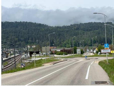
© Bernard Lensele, Gare de Nurieux-Volognat