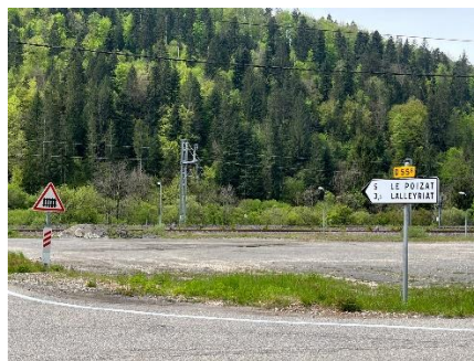
le LEX, la gare de Bellegarde et le site de Moulin de Charix

>>> Inscription gratuite et obligatoire <<< auprès de Ismaël SYLLA, i.sylla@mairie-chambery.fr ,