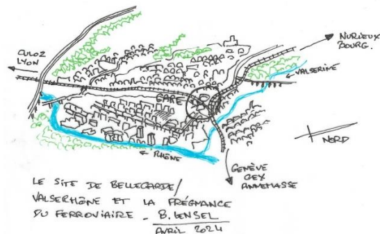
© Bernard LenseL, Vues de la gare et du site de la commune de Valsérhône

La réalisation du LEMAN EXPRESS, alias CEVA (pour Cornavin-Eaux Vives-Annemasse), a impacté positivement tous les territoires de l'Ouest lémanique desservis par ce réseau ferroviaire spécifique ; la traversée du Rhône en aval du lac et la mise en contact des composantes aindinoises, genevoises, haut-savoyardes et vaudoises du Grand Genève ont renforcé la personnalité d'une métropole en plein essor démographique, économique et environnemental.