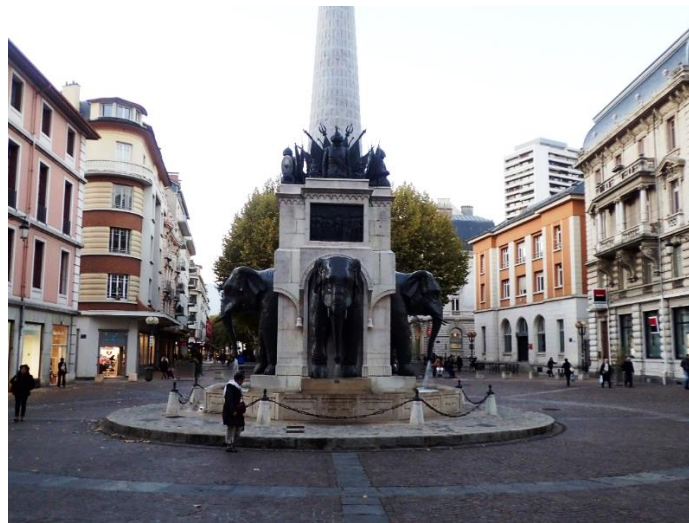
Chambéry, Fontaine des Eléphants

CHAMBERY Salle Cœur de Mérande (voir plan de situation)