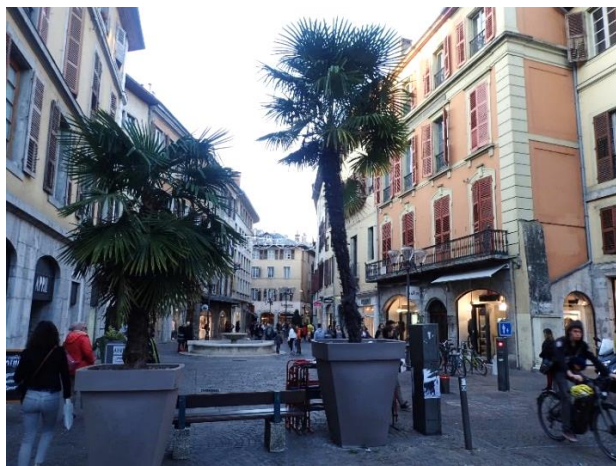
Chambéry, Place Saint Léger, © Bernard LENSEL