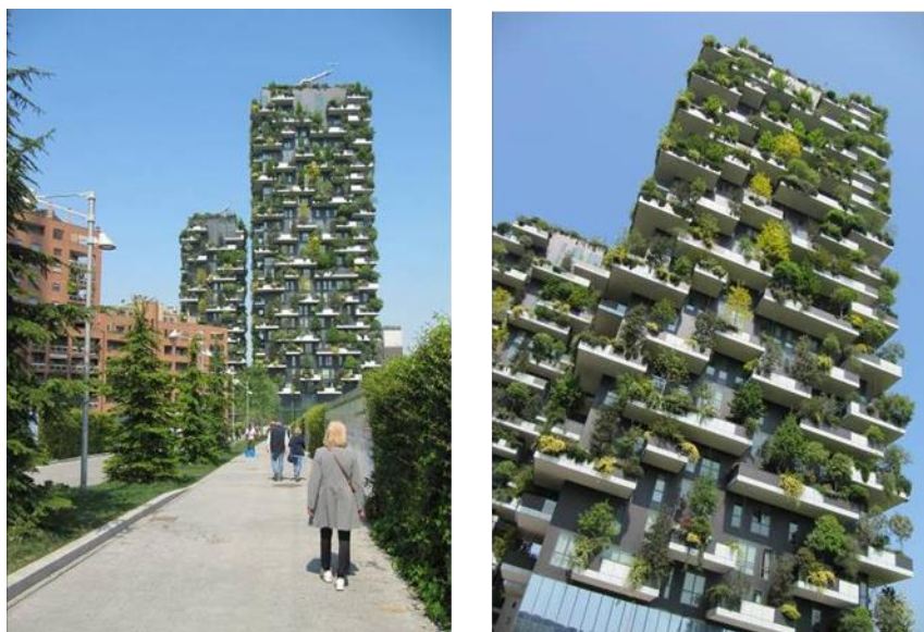
Figure 1 et 2 : Bosco verticale, Milan (Italie) avril 2017

expériences et professions leur permettant de voir, apercevoir et interpréter ensemble la ville d'une manière compréhensive, globale.