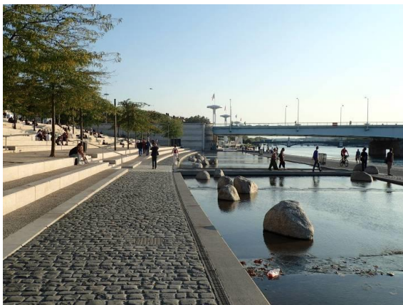
Figure 5 : Aménagement des Berges du Rhône, à Lyon (France)

tels que « expertise d'usage », « savoirs d'usage » et « maîtrise d'usage » et le désir d'habiter autrement traduit par une évolution écologique des modes de vie observée par Dobré et Juan (2009). Laurene Wiesztort signale l'apparition en ville de nouvelles formes de nature urbaine, qu'elle nomme « nature filtrée » 14 .