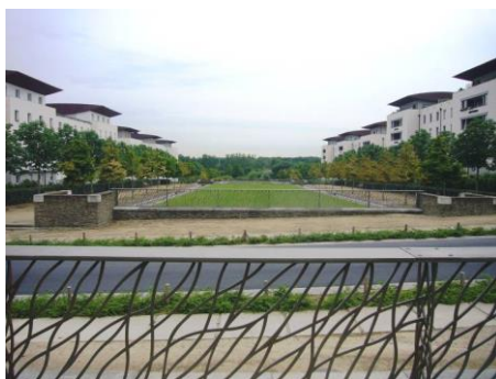
Figure 3 : Nouveau quartier à Carquefou, Nantes Métropole (France)

Reste à assurer cet équilibre entre les différentes fonctions de la ville, ce qui n'est pas chose facile : la répartition des activités dans la ville, le rapport entre bâti et végétal, les compatibilités et les interactivités entre différents éléments sont autant de variables que le curseur de l'urbanité doit gérer avec doigté.